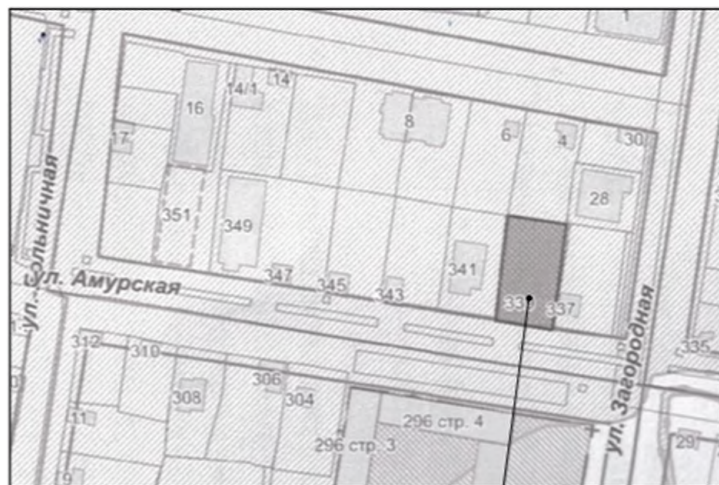
Участок строительства с кадастровым номером 28.01010425.14